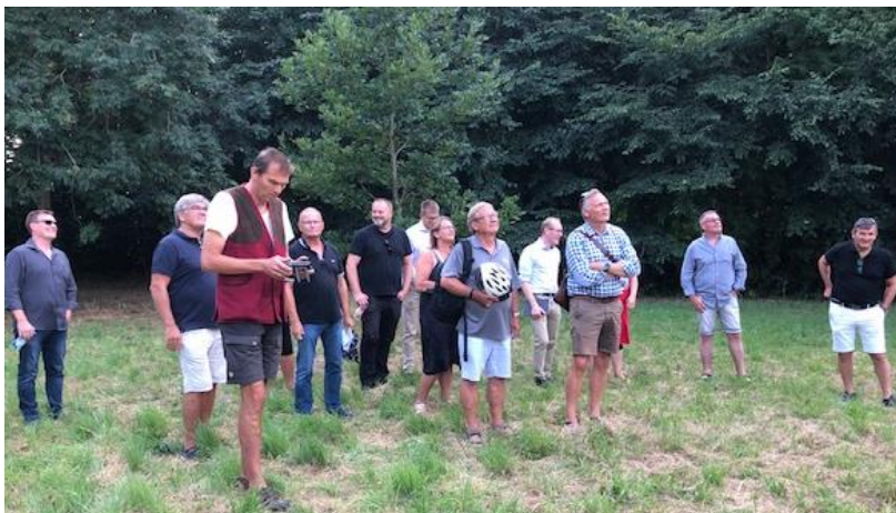
Byrådet på græsplænen mellem "Det Gamle Traktørsted" og Haraldsted Sø, hvor det nye Natur- og Aktivitetshus skal ligge.

Med godkendelsen den 6. december 2021 har Søskovlandet fået et langt bedre fundament for at komme videre med indsamlingen af de manglende midler til projektet. Vi kan nu med vægt kommunikere, at der både i udvalg, i byrådet og blandt kommunens borgere er stor opbakning til et nyt Natur- og Aktivitetshus i Vrangskov. Et element i Ringsted Kommune, som, på linje med Oplevelsesstien, vil være med til at give borgerne god adgang til naturen og til fine og spændende naturoplevelser og læring.