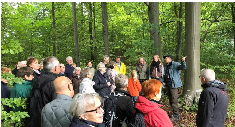
Borgere fra Kværkeby, Vigersted, Jystrup og Haraldsted ved et af de indledende klyngemøder, hvor Naturpark og "Huset" var i støbeskeen.

En særlig tak skal også lyde til Naturstyrelsen, som fra dag et har været konstruktiv og positiv. Ikke mindst med det for øje, at en statsskov er vores allesammens skov, som vi som borgere skal kunne benytte og have glæde af.