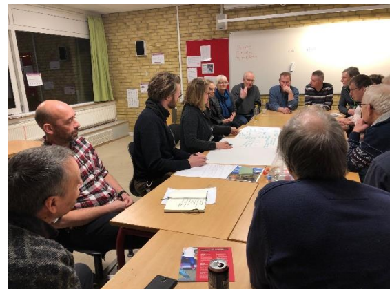
Mange borgere har givet værdifulde input til Natur- og Aktivitetshuset i Vrangskov.

Forud for Byrådsmødet blev direktionens indstilling godkendt i nedenstående udvalg: Børne- og Undervisningsudvalget* Klima- og Miljøudvalget* Kultur- og Fritidsudvalget* Plan- og Boligudvalget* Social- og Arbejdsmarkedsudvalget* Ældre- og Genoptræningsudvalget* Økonomiudvalget Byrådet*