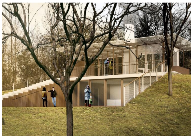
En foreløbig skitse af "Huset". Det tænkes at blive bæredygtigt og med opfordring til læring i naturen.