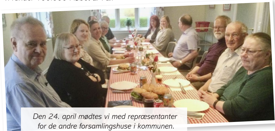
Den 24. april mødtes vi med repræsentanter for de andre forsamlingshuse i kommunen.

Vigersted Forsamlingshus drives af bestyrelsen i Støtteforeningen for Vigersted Forsamlingshus. Bestyrelsen arbejder frivilligt og ulønnet.