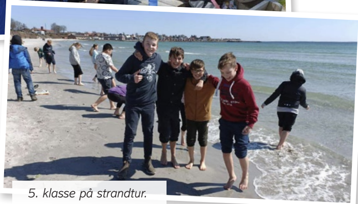
5. klasse på strandtur.

Universe science Park, hvor de bl.a. prøvede at være raket-ingeniører, var i Dybbøl, hvor de fik undervisning om krigen i 1864 og var på shoppetur til Sønderborg. Alle steder de kom, blev eleverne rost af de undervisere de havde. Rosen gik på at eleverne var omsorgsfulde, engagerede, nysgerrige og respektfulde både overfor undviserne og overfor hinanden. Eleverne blev på denne tur sat i andre grupper end de plejer og fællesskabet i klassen blev virkelig styrket.