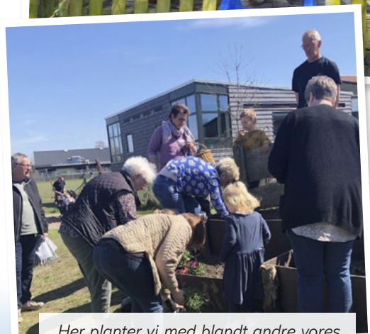
Her planter vi med blandt andre vores bedsteforældre til besøgsdag i huset.