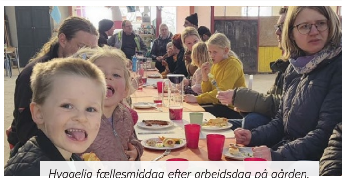
Hyggelig fællesmiddag efter arbejdsdag på gården.