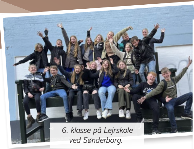
6. klasse på Lejrskole ved Sønderborg.