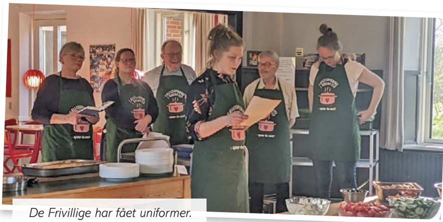
De Frivillige har fået uniformer.

I første kvartal var der ikke lejet ud til private fester en eneste gang. Nu er der stort set lejet ud hver weekend frem til 1. juli. Til gengæld har der været mange andre arrangementer. Så mange, at der nu står 68.000 kr. på tagaktiekontoen. Alt overskud fra eksempelvis fællesspisning, søndagscaféer, smagninger, storskærm, foredrag og koncerter går ind på den konto. Målsætningen er, at vi runder 100.000 i løbet af i år.