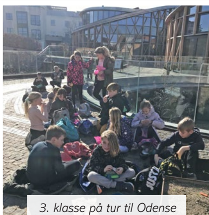
3. klasse på tur til Odense og H. C. Andersens hus.

Nu nærmer tiden sig, hvor vi skal sige farvel til vores 9. klasses elever. I april havde de deres sidste overnatning på skolen, da de syntes det kunne være hyggeligt at slutte af med, inden de for alvor skal i gang med eksamensforberedelser, skriftlige eksamener, sidste skoledag og til sidst dimission. Vi glæder os over, at vi har fået lov til at følge deres udvikling gennem årene og at vi nu kan sige på gensyn til en skøn flok unge mennesker som