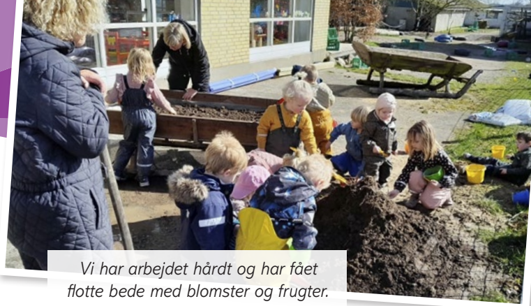
Vi har arbejdet hårdt og har fået flotte bede med blomster og frugter.