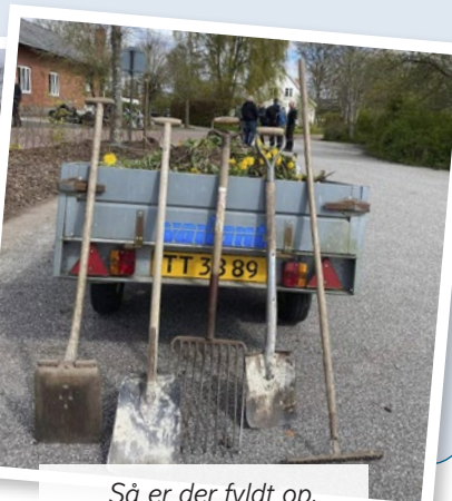
Så er der fyldt op.