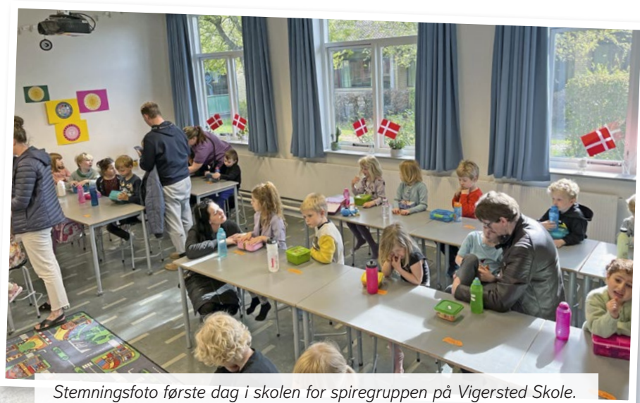
Stemningsfoto første dag i skolen for spiregruppen på Vigersted Skole.