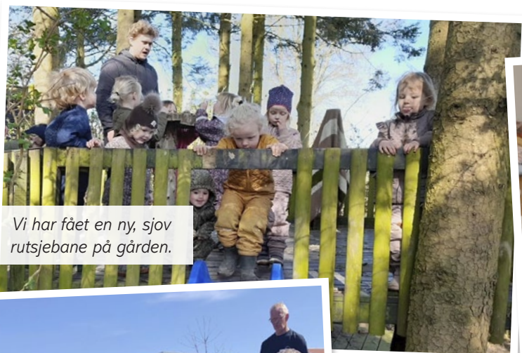
Vi har fået en ny, sjov rutsjebane på gården.