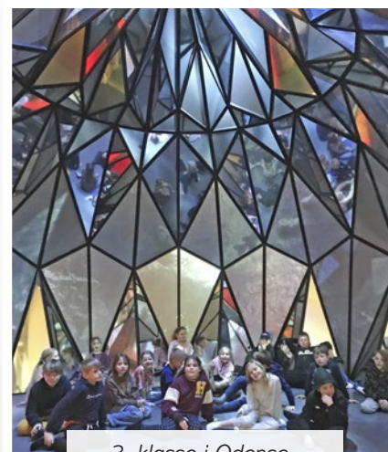
3. klasse i Odense.