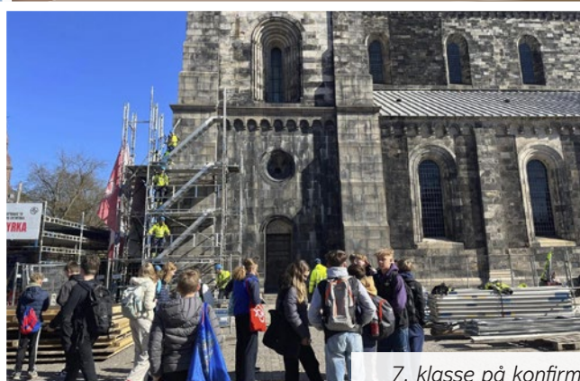
7. klasse på konfirmandtur i Lund i Sverige.

nu er flyveklar til at drage ud i verden på nye eventyr.