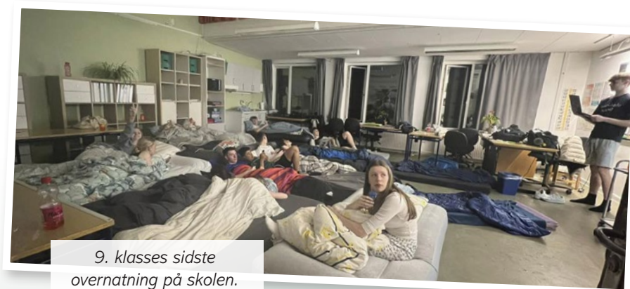
9. classes sidste overnatning på skolen.