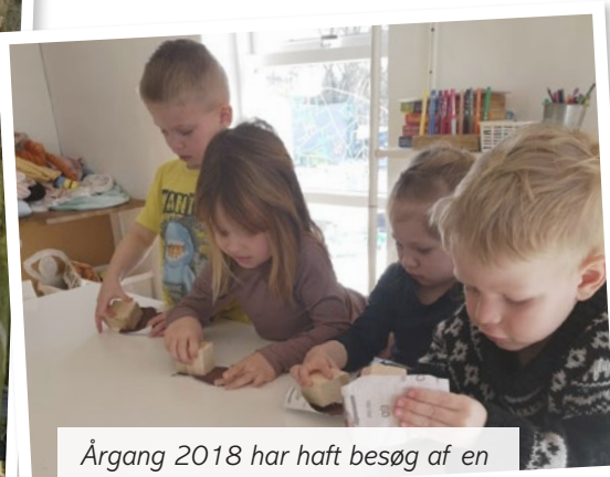
Årgang 2018 har haft besøg af en billedkunstner og lavet flot kunst.