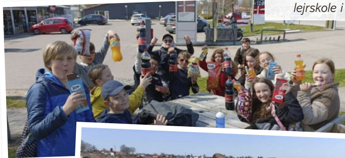
5. klasse på lejrskole i Rørvig.

6. klasse var på 5 dages lejrskoler ved Sønderborg og besøgte både